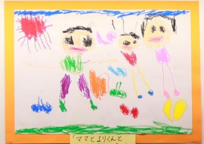
「ママとパパと おにいちゃん」 3才児