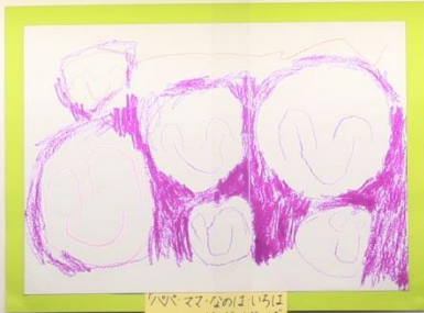
「ママとパパは いい、いい」 3才児