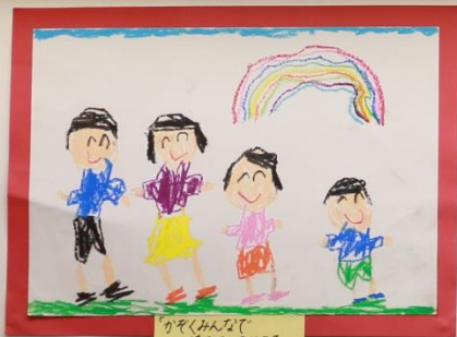
「かぞくみんなが にじをみているところ」 4才児