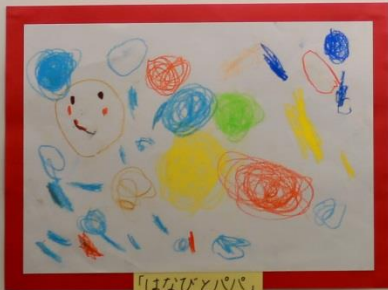
「はなびとパパ」 3才児