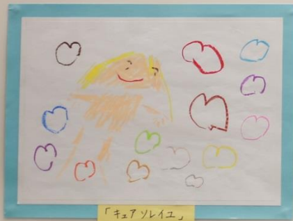
「キューソレイユ」 4才児