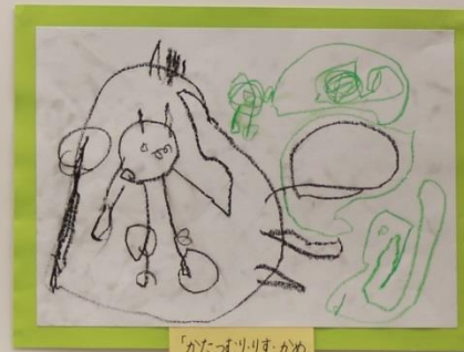
「かたむすしりすかめ」 4才児