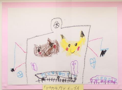
「ピカチュウとイーブイ」 5才児