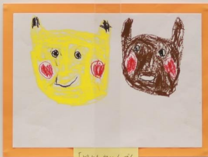
「ピカチュウとイーブイ」 5才児