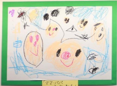
「ママとパパ いた、きいちゃん」 3才児