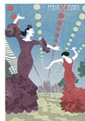
⑮ FERIA DE ABRIL 1