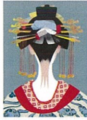
② 花魁 (その2)