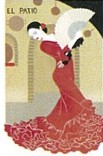
⑩ EL PATIO 1