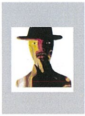
⑥ Poker face