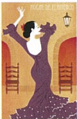
⑨ NOCHE DE FLAMENCO 1