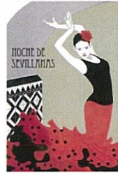
⑦ NOCHE DE SEVILLANAS