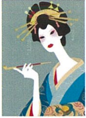
① 花魁 (その1)