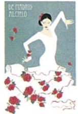
⑫ DE MADRID AL CIELO