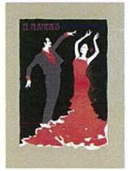
⑧ EL FLAMENCO