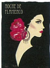
⑭ NOCHE DE FLAMENCO 2