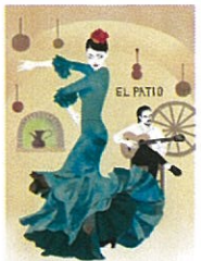
⑬ EL PATIO 2