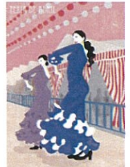
⑯ FERIA DE ABRIL 2