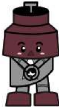
川口市マスコット「きゅぼらん」